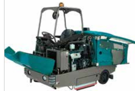
Diseño de fácil acceso