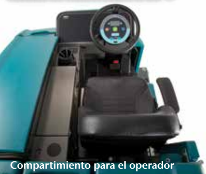
Compartimiento para el operador