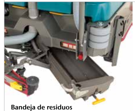
Bandeja de residuos