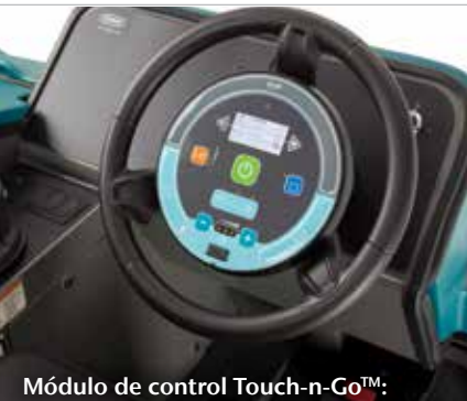
Módulo de control Touch-n-Go™: