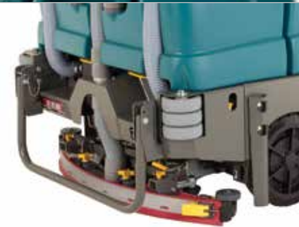
Escurreidor parabólico Dura-Track™